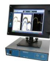
Echotrac CV200 Двухчастотный эхолот для монтажа в стойку