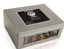
Echotrac CV100 Небольшой, водозащищённый однолучевой эхолот