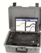
Echotrac CVM Мобильный двухчастотный эхолот