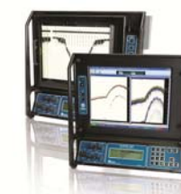
Echotrac Mk III Максимально оснащённый двухчастотный эхолот