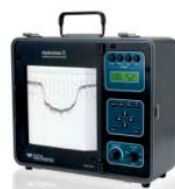
Hydrotrac II Надёжный, переносной, однолучевой эхолот

Шаг 3: Сделай заключение, сравнив Характеристики